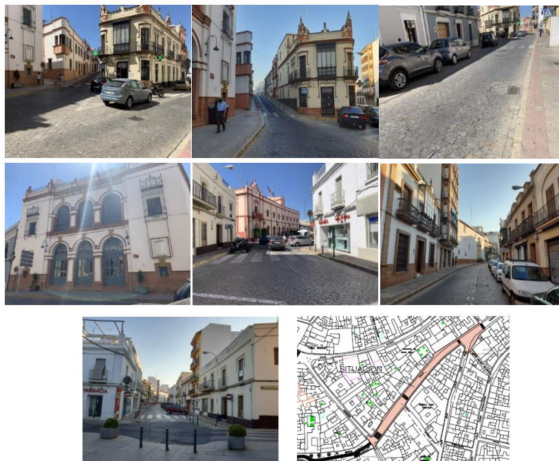
Imágenes del estado actual del ámbito de actuación de la rehabilitación de la C/Ntra. Sra. del Águila y ubicación.

Además, supone crear un espacio único de paseo y esparcimiento que discurre desde el Recinto Fortificado al centro de la ciudad, que atraería a los vecinos hasta un centro histórico renovado y amable, y al turista a bajar desde el Castillo a la zona céntrica, comercial y de servicios, de la ciudad.