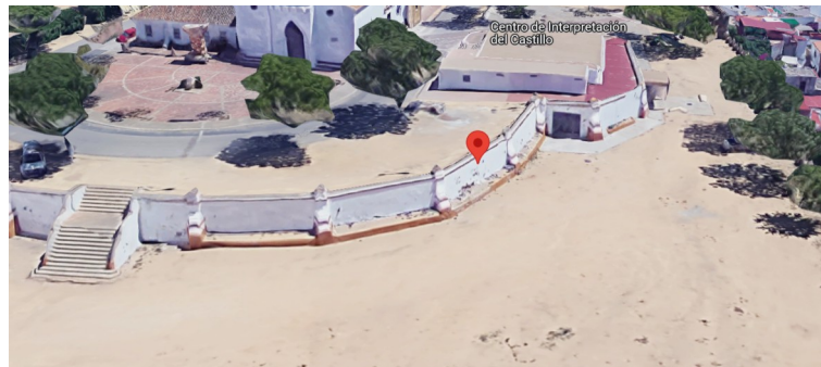
Imágenes actuales del CIC.