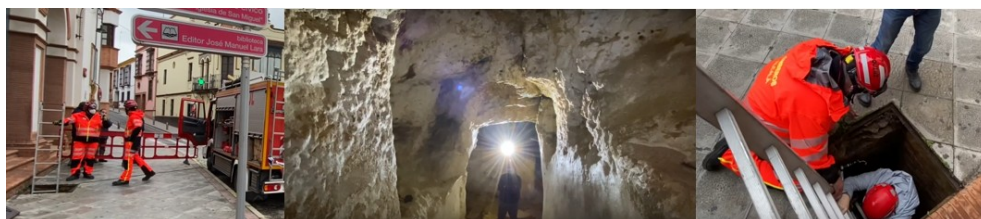
Imágenes del acceso actual.

Para poder visitar el Molino, es necesario llevar a cabo una rehabilitación integral de la Calle de Ntra. Sra. del Águila, mediante la construcción de una estructura en superficie que permita dar acceso y bajar a la cota en la que se encuentra el Molino. Es necesario también acometer una adaptación del entorno urbano el que se encuentra este elemento patrimonial creando un espacio más adecuado y adaptado para recibir a los futuros visitantes a través de una movilidad funcional, más sostenible e integrada en el espacio urbano del Centro Histórico de Alcalá, donde se ubica.