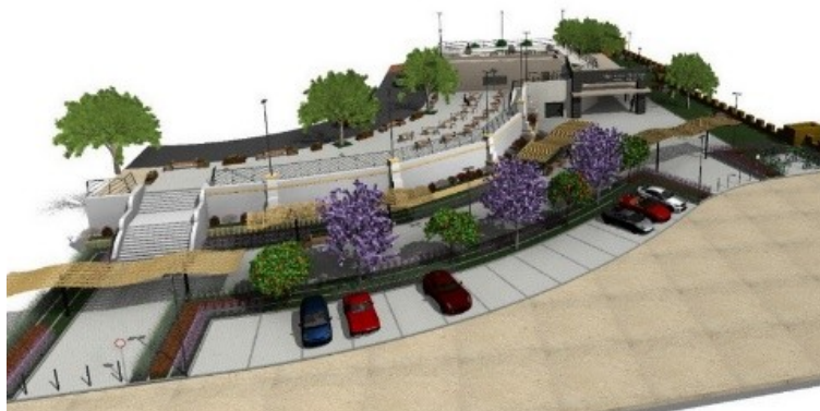
Infografía de la rehabilitación del exterior y accesos del CIC.

Esta actuación se enmarca dentro de las medidas descritas en el O.E. 6.3.4. del POPE, denominada “Desarrollo y promoción de activos culturales urbanos, en particular orientados al desarrollo del turismo” (página 288, https://www.fondoseuropeos.hacienda.gob.es/sitios/dgfc/es-ES/ipr/fcp1420/p/Prog_Op_Plurirregionales/Documents/POPE-Version_13-0.pdf ) y da respuesta a la tipología de actuaciones de la LA 4 Alcalá, Patrimonio Natural, Histórico y Cultural , “Mejora y adecuación de los recursos turísticos, naturales y culturales”.