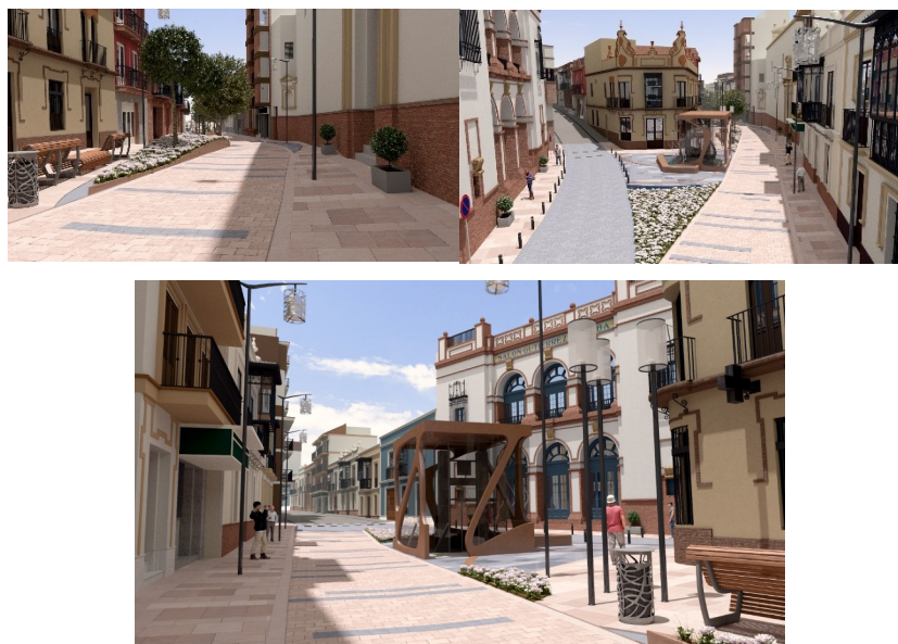
Infografía del resultado final previsto tras la rehabilitación de la C/Ntra Sra. del Águila e intervención en el Molino de la Mina.

Esta actuación se enmarca dentro de las medidas descritas en el O.E. 6.3.4. del POPE, denominada "Rehabilitación de centros históricos y otras áreas urbanas dotadas de patrimonio cultural." (página 286, https://www.fondoseuropeos.hacienda.gob.es/sitios/dgfc/es-ES/lipr/fcp1420/pl/Prog_Op_Plurirregionales/Documents/POPE-Version_13-0.pdf ) y da respuesta a la tipología de actuaciones de la LA 4 Alcalá, Patrimonio Natural, Histórico y Cultural, "Rehabilitación de zonas históricas".